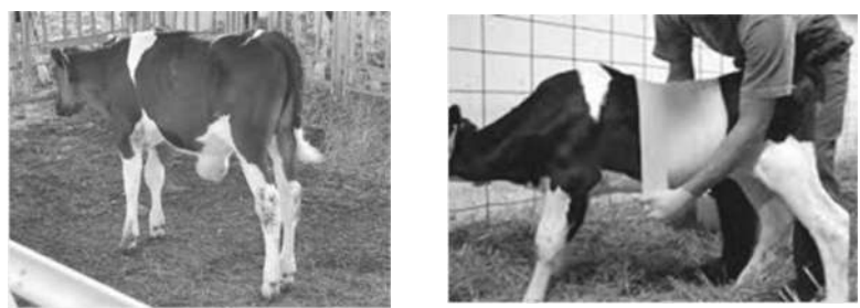
avE 2. 0k0AiAA DVGA aA ÞjA «UE J - A zEqNgE iO ¼AqAdA vAVvGA aAzA