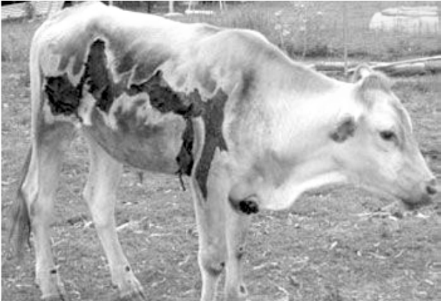
°ÁÁÁÈÈ ÈWÁÁÈ ÁÁUÁÁÁ