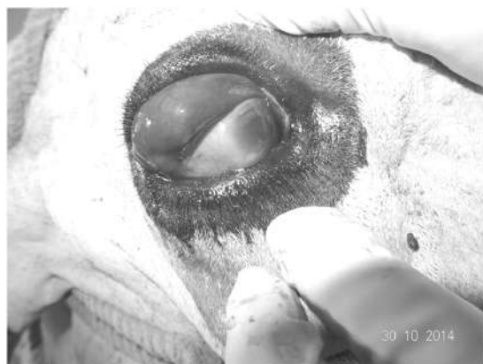
JwIEA PAt IEA e °Aa a AVAU °ME ©CgAa AZA