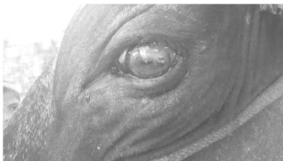
JwIEA PAt IEA e °ME ©CgAa AZA